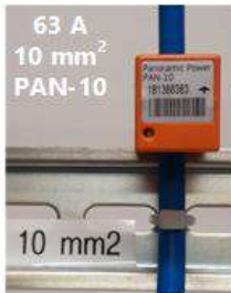
63 A 10 mm 2 PAN-10

Acquisizione impulsi dai contatori elettrico, gas, acqua, calore