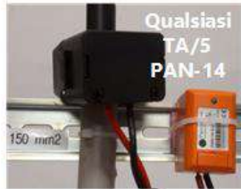
Qualsiasi TA/5 PAN-14

Sensori wireless autoalimentati apribili e di piccole dimensioni Si adattano a qualsiasi quadro elettrico, non richiedono modifiche impiantistiche Non devi spegnere le utenze e non devi fare nessun cablaggio