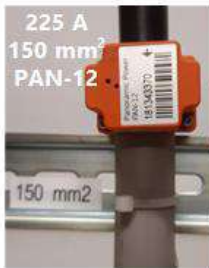
225 A 150 mm 2 PAN-12